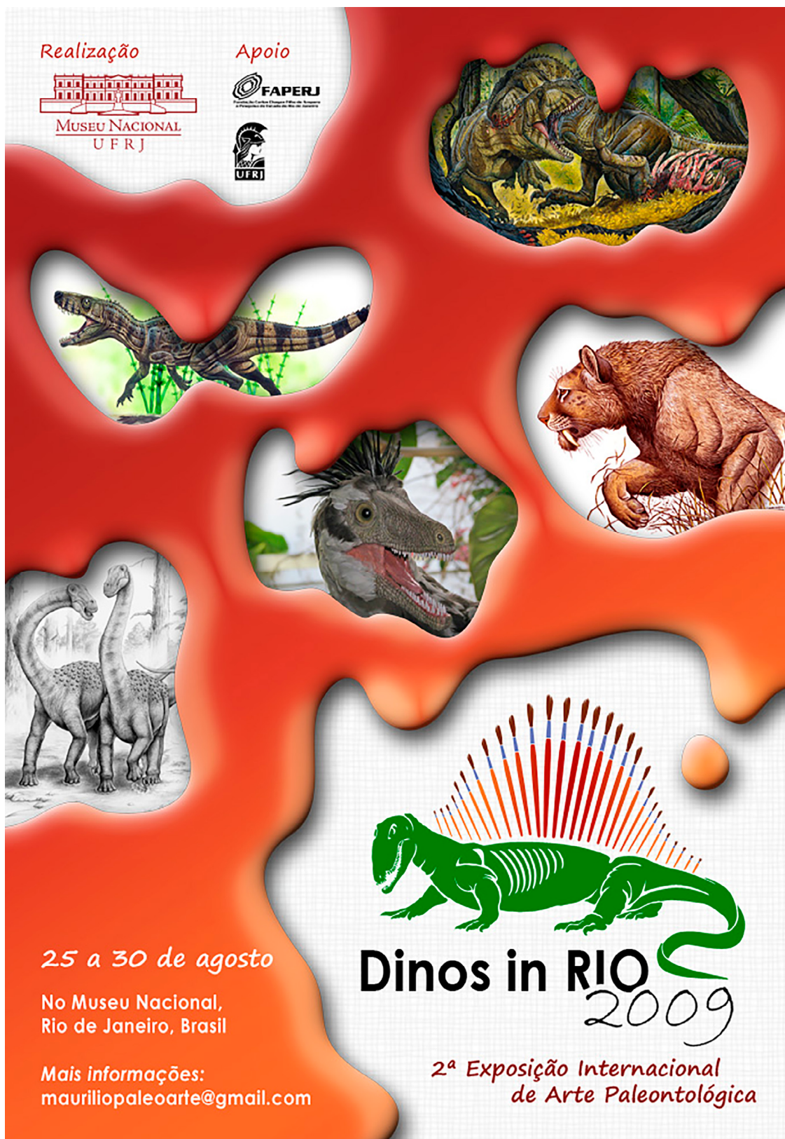
Figura 4. Folder da 2ª exposição internacional de arte Paleontológica "Dinos in Rio". Figure 4. Brochure of the 2nd International Paleart Exhibition "Dinos in Rio".