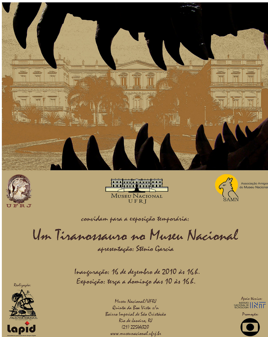
Figura 6. Folder da exposição “Um Tiranossauro no Museu Nacional”. Figure 6. Brochure of the exhibition “Um Tiranossauro no Museu Nacional”.

A educação não formal ocorre em ambientes marcados pela coletividade e pela interação, sendo orientada por práticas que favorecem a construção de aprendizagens. Nesse contexto, caracteriza-se por ocorrer fora da estrutura escolar, em espaços não convencionais como museus e zoológicos, de forma intencional, sem organização por séries, idade ou conteúdos predefinidos, e baseada na troca direta de saberes. Dessa forma, volta-se, sobretudo, para processos de produção de saberes coletivos (Gohn, 2006a).