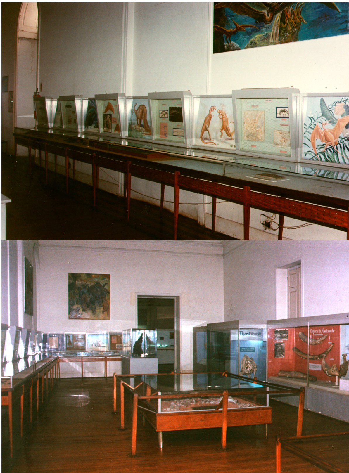
Figura 5. Exposição Permanente nos anos 80/90. Presença dos elementos artísticos nas vitrines, vitrines em L.