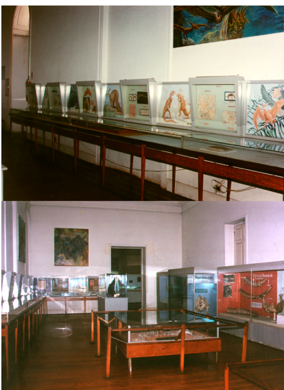
Amaral et al., 2025. Paleontologia em Destaque , v. 40, n. 83, p. 110, Figura 5.