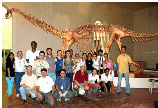
Esqueleto do dinossauro Maxakalisaurus topai exposto no Museu Nacional, RJ.

A foto abaixo é de Maxakalisaurus topai , um dinossauro saurópodo, que acaba de ser montado e exposto no Museu Nacional. Veja mais informações em “links interessantes – Caçadores de Fósseis”.