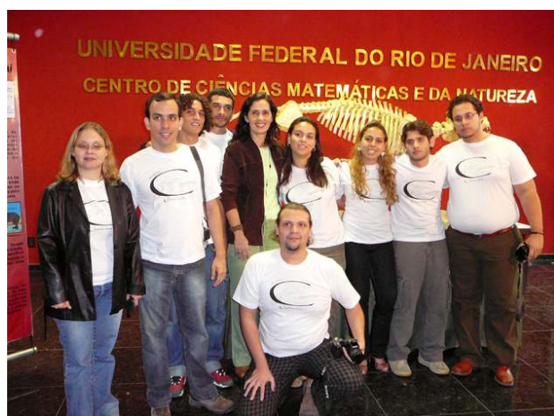
Equipe responsável pela montagem do esqueleto.

Junto com o esqueleto de Carodnia , uma pequena exposição mostrava as diferentes etapas do processo de reconstituição, assim como fósseis originais da Bacia de Itaboraí. Imagens das vitrines e o conteúdo dos painéis podem ser acessados na página www.cchm.ufjf.br A montagem do esqueleto durou 14 meses e contou com o apoio de paleoartistas, técnicos, consultores e demais colaboradores.