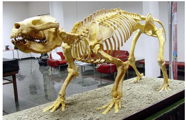
Carodnia vieirai, um dos mais antigos mamíferos fósseis da América do Sul a ter seu esqueleto montado.