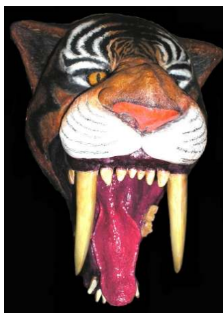
Escultura de Smilodon (tigre dente de sabre). Técnica: gesso e tinta acrílica. Autor: Dr. Jorge Ferigolo (exibida durante o V SBPV, em Santa Maria, RS)